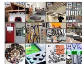
Projekte der Siemens-Führungskräftetagung

Das Internet ist mit mobilen Laptops in allen Räumen erreichbar und kann von den Schülern darüber hinaus im „com.1“ und in der Bibliothek ganztägig genutzt werden.