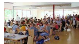
GMG-Mensa am Mittag