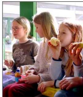
Schülerinnen während einer Obstpause