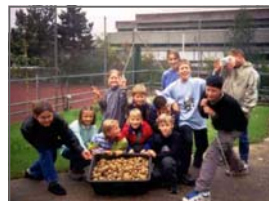
Kartoffelernte im Biogarten

Wahlunterrichte, Arbeitsgemeinschaften: abhängig von Interesse und Stundenbudget z.B. Instrumentalunterricht, Chor, Orchester, Big Band, Werken, Textilarbeit, Photokurs, Spanisch, Chinesisch, Informatik, Textverarbeitung, Umweltgruppe, Schulgarten, englische Konversation, Politik und Zeitgeschichte, Pluskurse, differenzierter Sportunterricht (Gymnastik/Tanz, Tischtennis, Badminton, Fußball, Schwimmen, Sportklettern etc.), Webteam, Mathematik-Olympiaden, Jugend forscht, Schulspiel, auch englischsprachig;